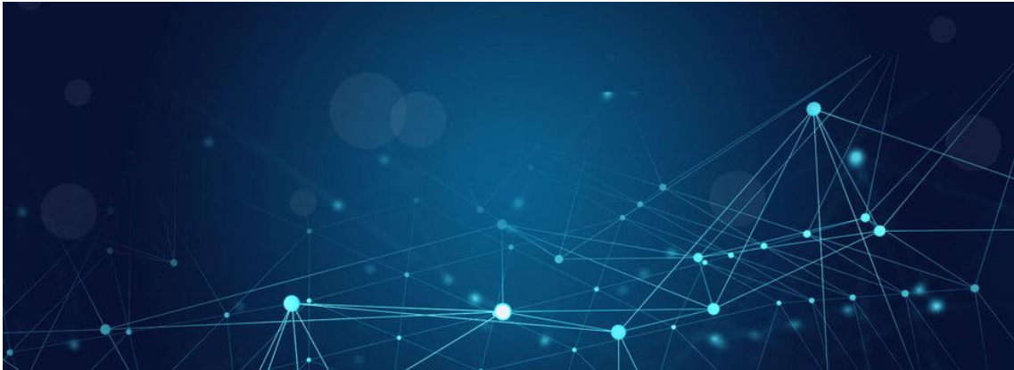
Imagen y reputación corporativa

JARA considera que uno de los elementos básicos que contribuyen a su imagen y reputación corporativa es el establecimiento de relaciones de ciudadanía responsable en aquellas comunidades en las que desarrolla su actividad. Todo el personal en el ejercicio de su actividad debe considerar los intereses de las comunidades locales. JARA considera su imagen y reputación corporativa como uno de sus activos más valiosos para preservar la confianza de sus clientes, empleados, proveedores, entidades públicas, y de la sociedad en general.